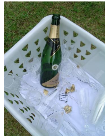
Die Dreharbeiten nahmen einen krönenden Abschluss

Und wie sagten alle am Ende der Dreharbeiten : Ein weiterer Filmdreh soll wieder stattfinden. Begeistert war jeder.